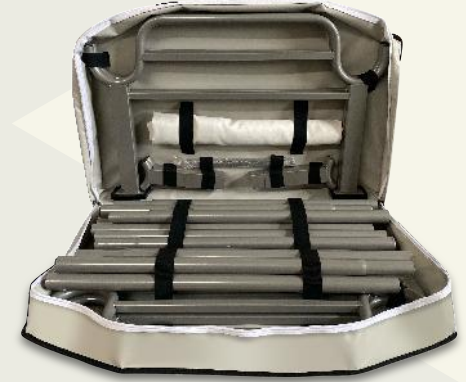
Mı u ı l r-rg k( Paket Ölçüleri : 16x57x89 cm ( ExBxY )

Düz bir eklede çıkarılabilir ve taşıma çantasına yerleştirilebilir