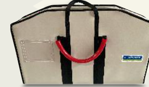
TK-5050 • k A ırlık : 18kg

Düz bir eklede çıkarılabilir ve taşıma çantasına yerleştirilebilir