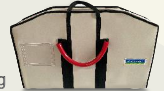
#K-5050 ~ k A ırlık : 18kg

The curative power of the hardest circumstances